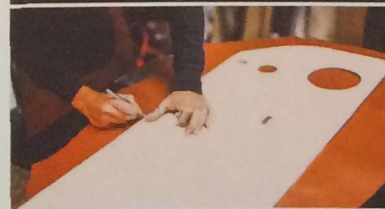
4 5 6 De la découpe à la couture en passant par l'assemblage, tout est réalisé à la main.