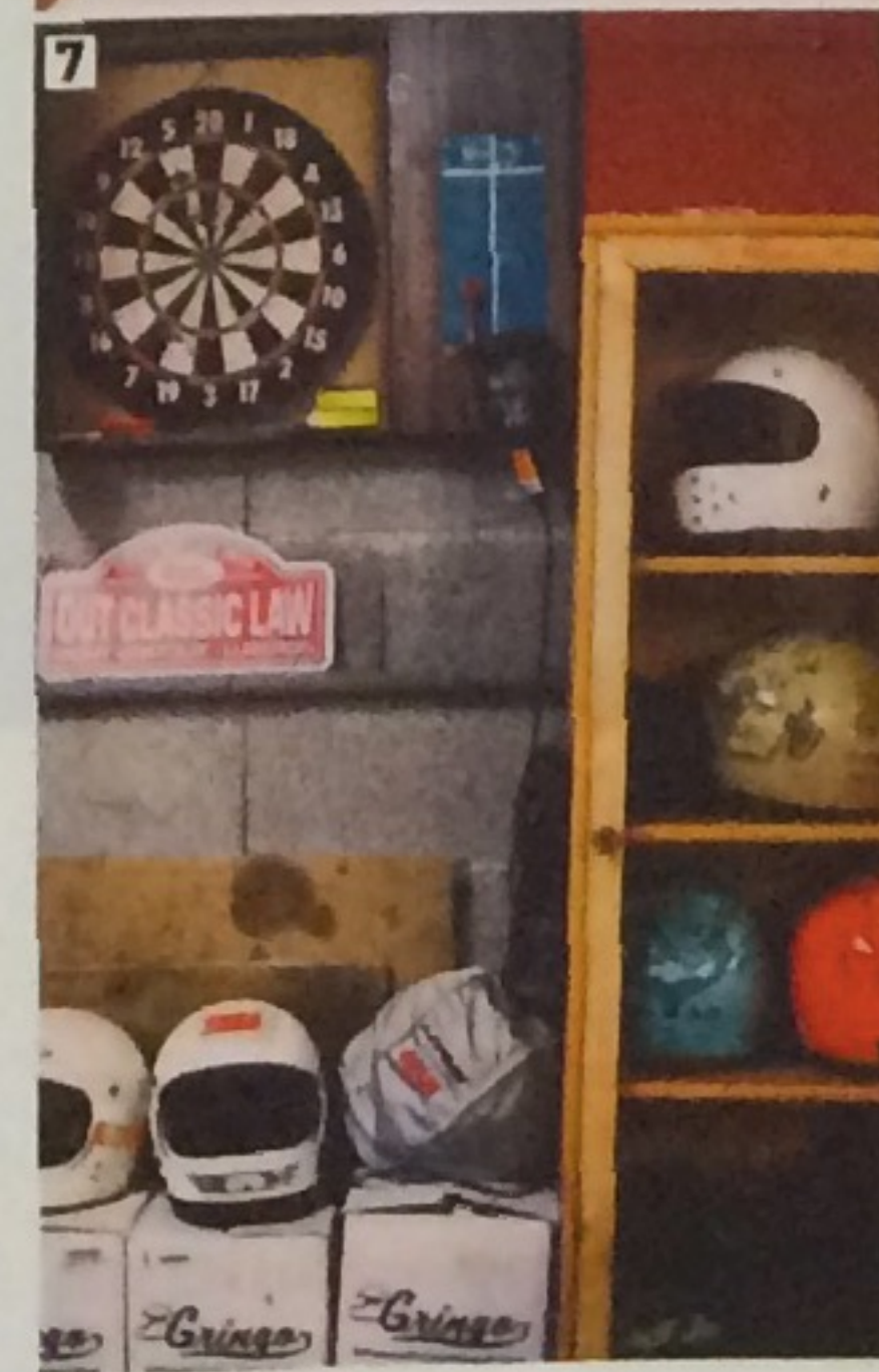
7 8 Non content de s'attaquer à la 911, Nicolas personnalise également des casques vintage. Il y a encore du stock !